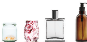
Pots, bocaux et flacons en verre