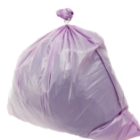
Vêtements, chaussures, maroquinerie