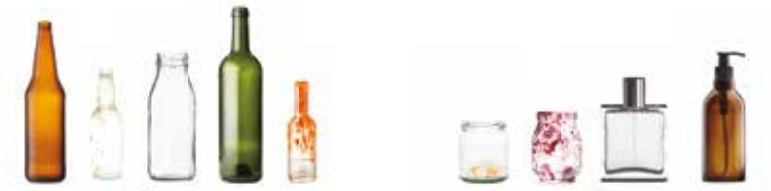
Bouteilles en verre

À DÉPOSER BIEN VIDÉS, SANS COUVERCLE, SANS PRÉLAVAGE