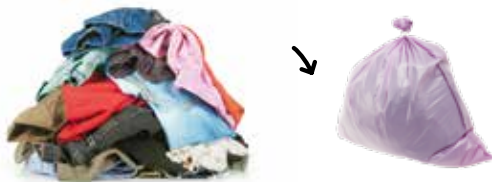
Vêtements, chaussures, maroquinerie

À DÉPOSER BIEN SECS ET PROPRES, MÊME ABÎMÉS, DANS DES SACS FERMÉS DE 30 LITRES MAXIMUM